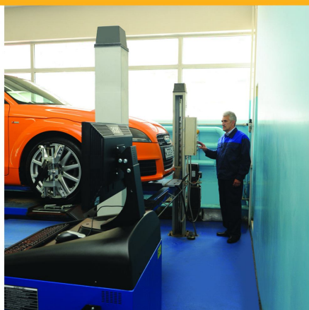
Предназначен для проверки и регулировки углов установки колес автомобилей с диаметром дисков от 12 до 24 дюймов